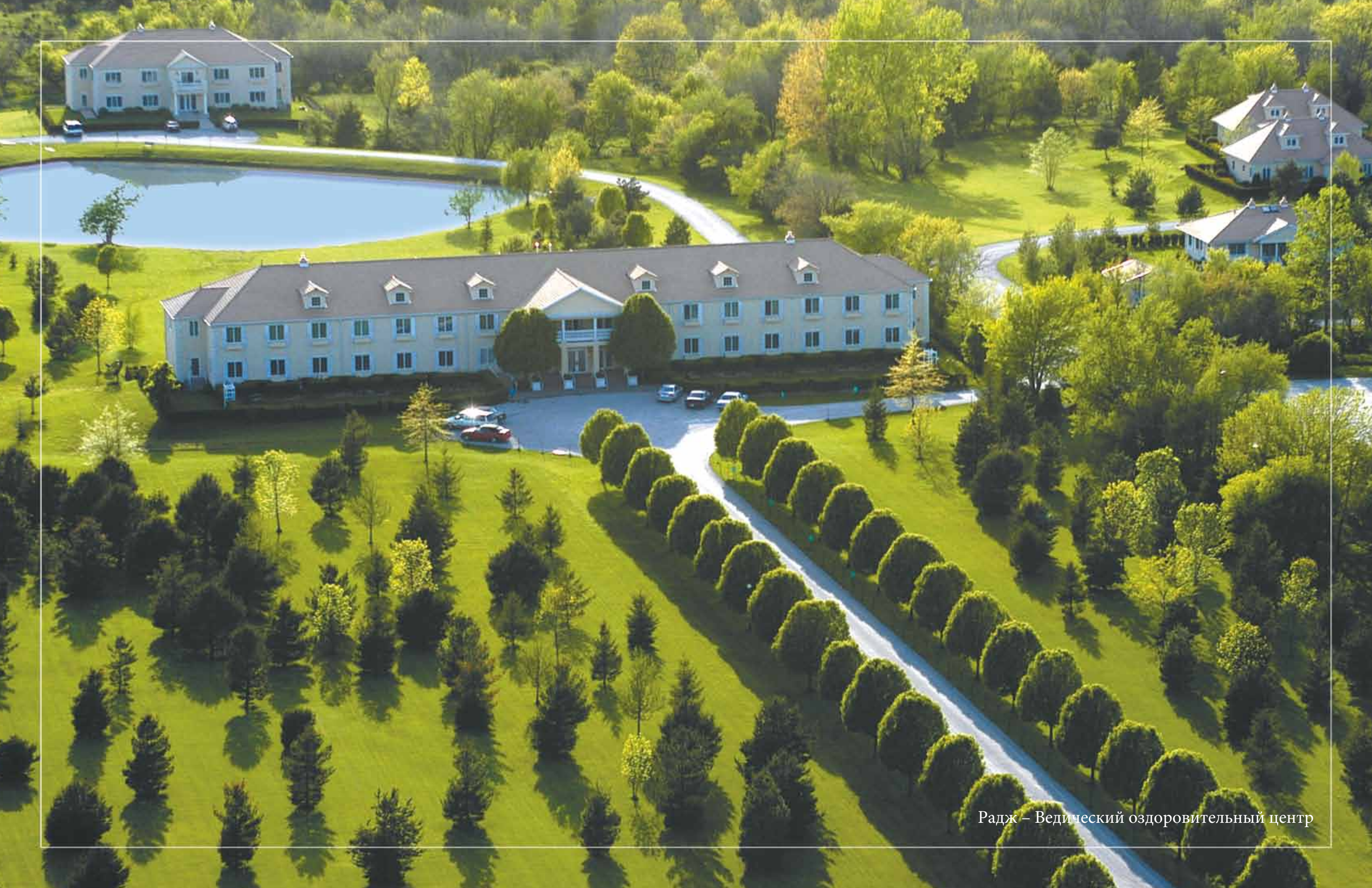
Радж – Ведический оздоровительный центр